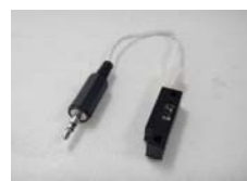
【リサイト用センサー】